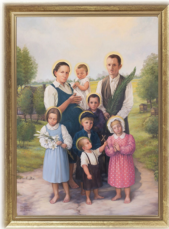
Oleg Czyżowski, Obraz beatyfikacyjny rodziny Ulmów,

Na uwagę zasługuje nie tylko fakt, że Ulmowie jako pierwsze małżeństwo w historii kościoła dostąpili błogosławieństwa wraz ze swoimi dziećmi, ale także bezprecedensowa decyzja beatyfikacji przychodzącego na świat dziecka. Jak wy-