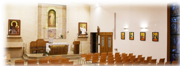
Kaplica Miłosierdzia Bożego, Haus Concordia

boisko do koszykówki i piłki nożnej, zadaszona scena koncertowa, miejsce na grill i ognisko oraz oczywiście Kaplica Miłosierdzia Bożego, która została wybudowana dzięki darom ludzi dobrego serca. Ciekawym faktem może być to, iż kamień węgielny pod kaplicę, pochodzi z muru Drzwi