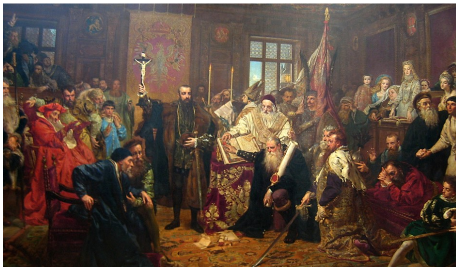
Unia Lubelska, Jan Matejko

Obecny rok jest kolejnym, szczególnym momentem w historii naszej Ojczyzny. Przypada w nim 450. rocznica podpisania Unii Lubelskiej. Podkreślając tę ważną rocznicę, Uchwałą Sejmu Rzeczypospolitej Polskiej z dnia 20 lipca 2018, rok 2019 został ustanowiony Rokiem Unii Lubelskiej