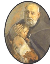
św. br. Albert Chmielowski patron naszej misji