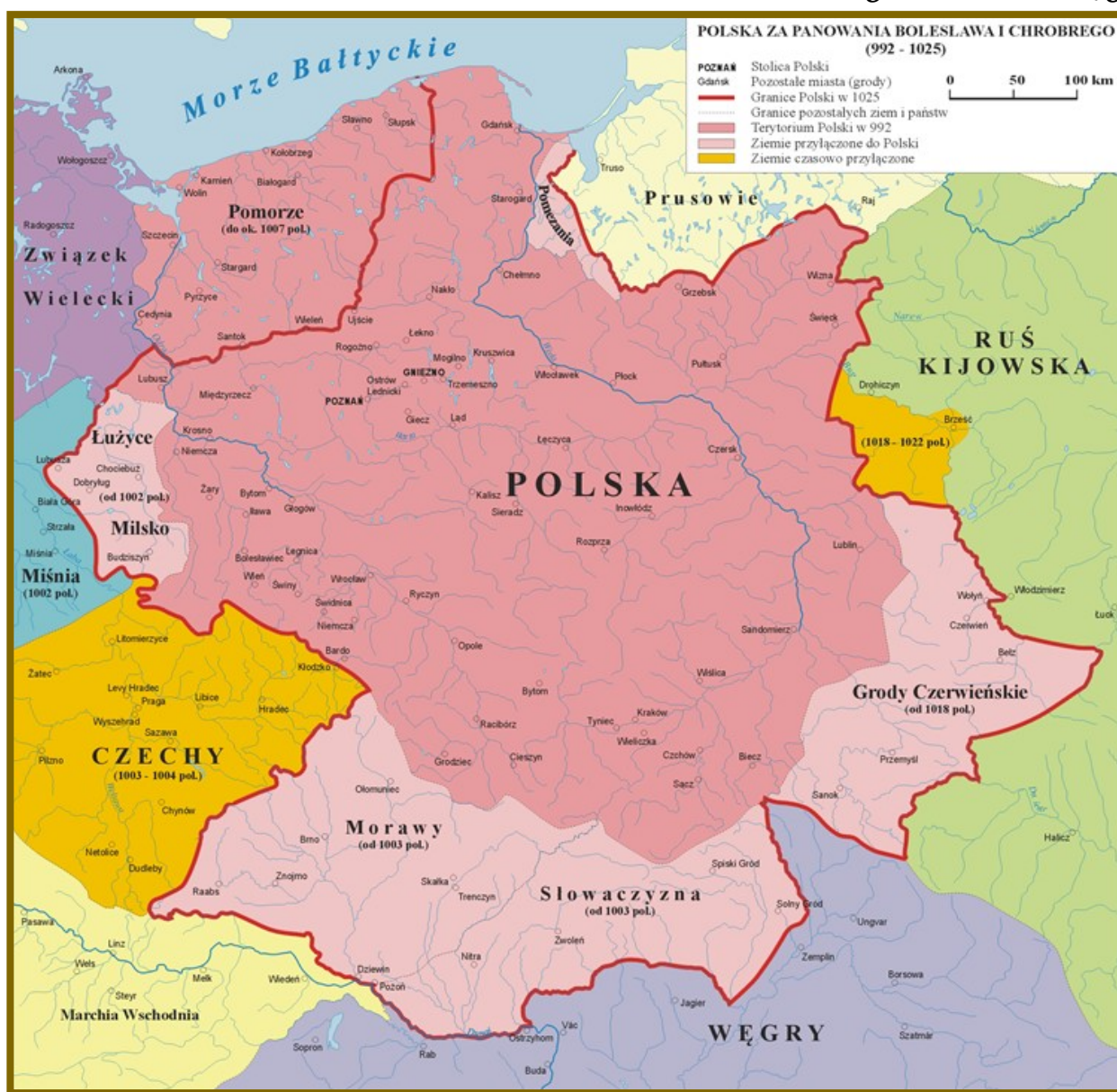
Polska za panowania Bolesława Chrobrego [3]