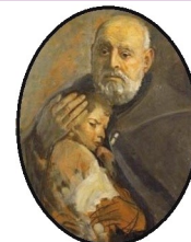
św. br. Albert Chmielowski patron naszej misji