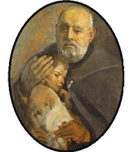
św. br. Albert Chmielowski patron misji