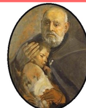
św. br. Albert Chmielowski