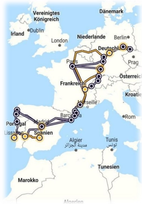
Nasza trasa do i z Portugalii

Nasz wyjazd i udział w ŚDM i Drodze św. Jakuba były cennym doświadczeniem i spotkaniem się z różnorodnością Kościoła i świata. Było to przeżycie pozytywne, uwrażliwiające, uczące pokory i wdzięczności za tak wiele otrzymanych darów i ludzi których spotkaliśmy na naszej drodze.