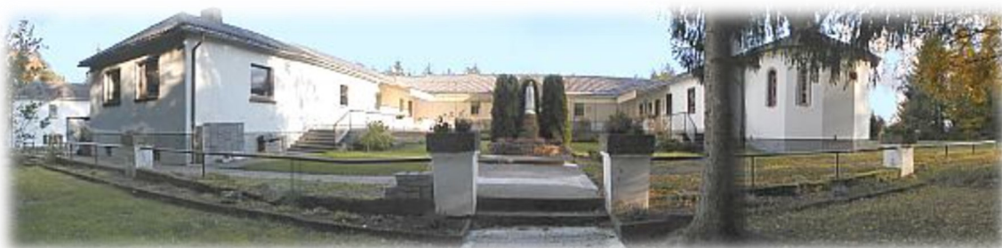
Centrum Ruchu Światło-Życie „Marianum”, Carlsberg

i umocnienia duchowego, które umożliwiają na nowo odkrycie wartości wiary.