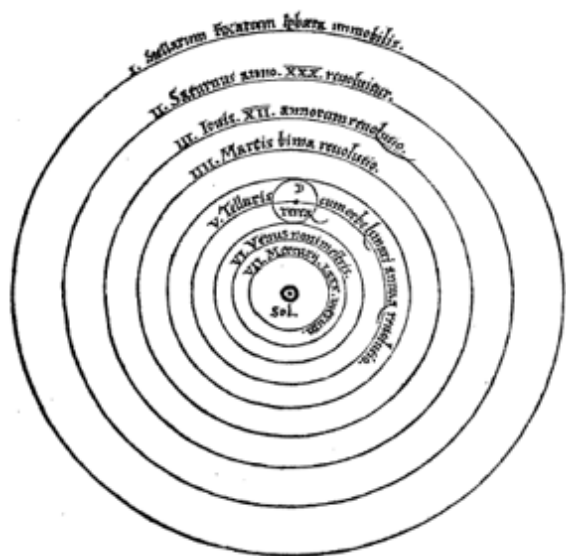
Kopernikowska wizja Wszechświata w De revolutionibus orbium coelestium .

volutionibus orbium coelestium), wydanym w Norymberdze w 1543 roku, wprowadził nowy, heliocentryczny model, według którego centrum naszego układu jest Słońce, zaś wszystkie planety, w tym Ziemia, krążą wokół niego po orbitach kołowych. Pomimo solidnych podstaw teoretycznych i szczegółowego opisu model heliocentryczny zaproponowany przez Kopernika nie przyjął się i przez wiele kolejnych lat świat pozostawał w przekonaniu, że Ziemia jest nieruchoma. Jednym z wilekich uczonych, będących zwolennikiem teorii Kopernika, był Galileusz. Jednakże jego walka na rzecz teorii Kopernika miała odwrotny skutek od zamierzonego i wraz z wieloma innymi księgami dzieło Kopernika trafiło na ponad sto lat na listę