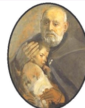
św. br. Albert Chmielowski patron naszej misji