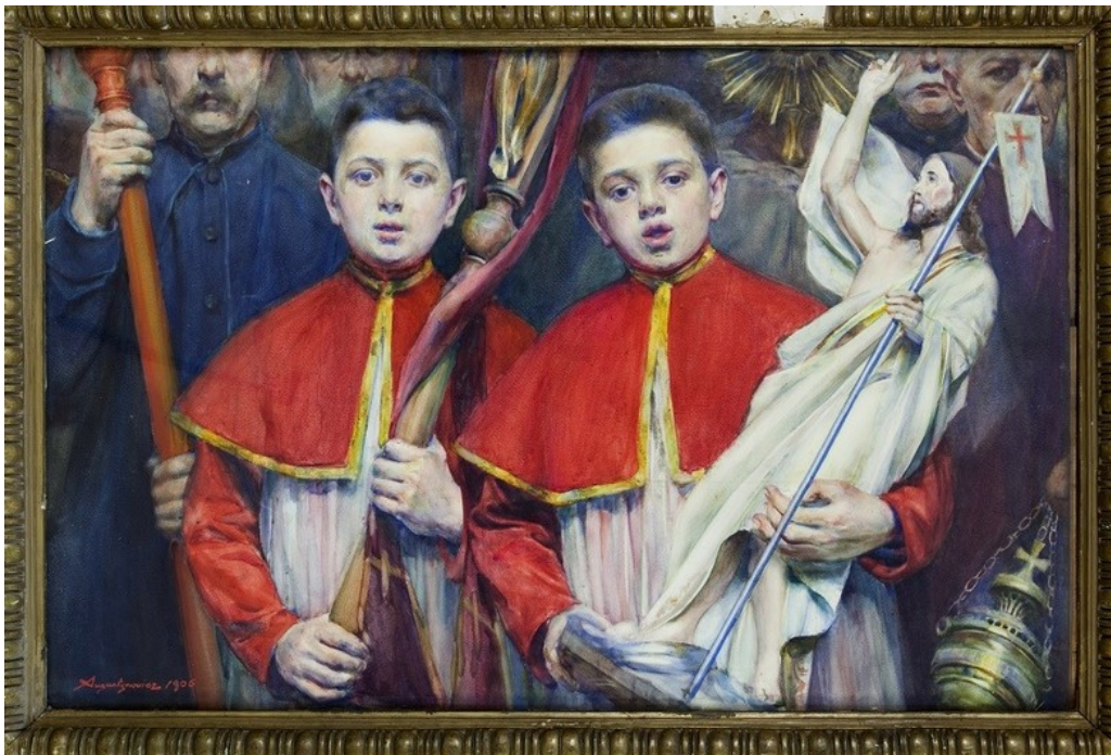
Aleksander Augustynowicz, Alleluja , 1906, akwarela